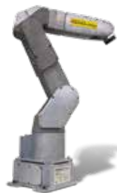
серии Paint Mate 200